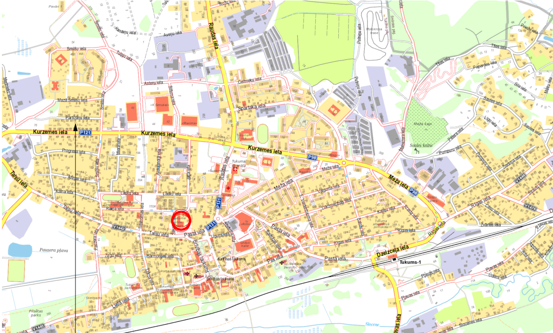
TUKUMA NOVADA DOMES ĒKA